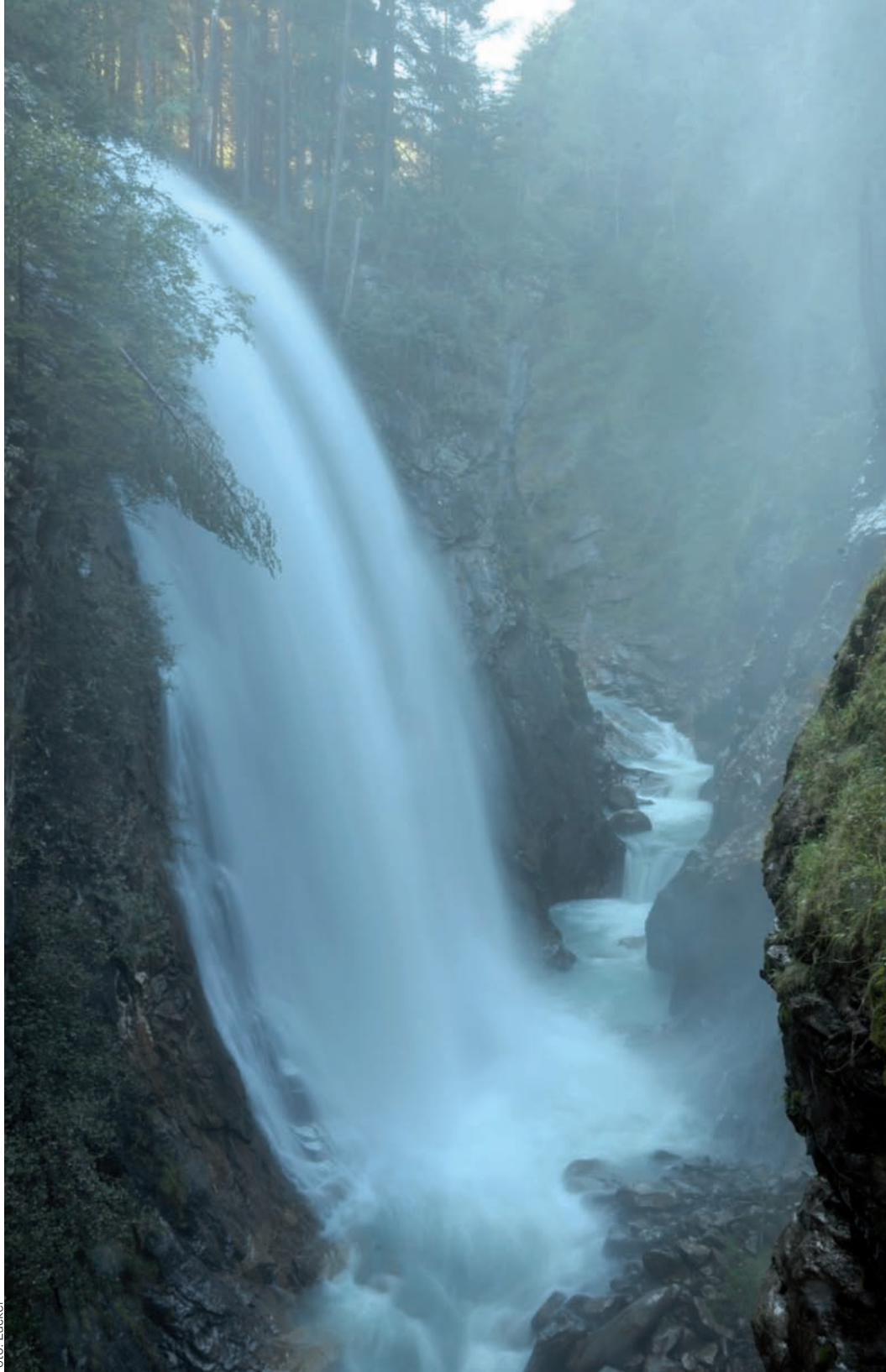
Bild: Dalla forza primordiale all'energia: le imponenti cascate di Riva

Per i fruitori di energia elettrica non c'è tanto da fare. Essi devono