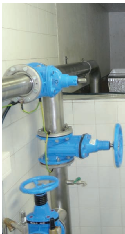
Collettore idrico Schattenberg

Contatori per l'acqua: questi sono messi a disposizione del singolo utente esclusivamente dal comune. I contatori infatti sono di proprietà di quest'ultimo e non possono essere manipolati. Anche gli apparecchi più nuovi, i quali permettono una lettura via radio o remota, non