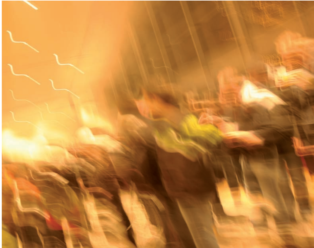
In movimento: a maggio sarà ufficialmente inaugurato il padiglione delle feste