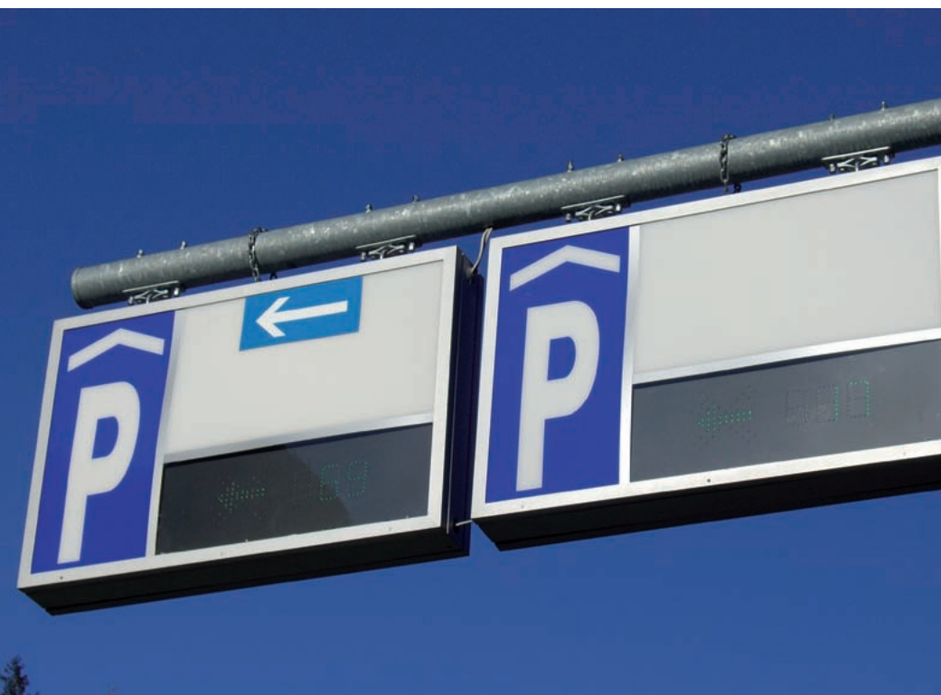
Bild: Di proprietà del comune: le strutture del comune in futuro saranno amministrate

LE STRUTTURE COMUNALI BENEFICIANO DI UN'AMMINISTRAZIONE CONDOMINIALE