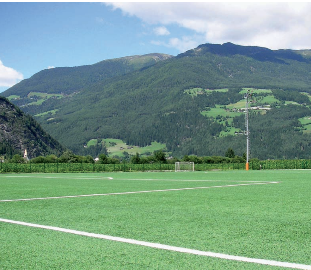
Erba sintetica: il campo da calcio di Molini è stato ritenuto adatto ad ospitare gare internazionali

IL CAMPO DA CALCIO DI MOLINI POTRÀ PERSINO OSPITARE GARE INTERNAZIONALI