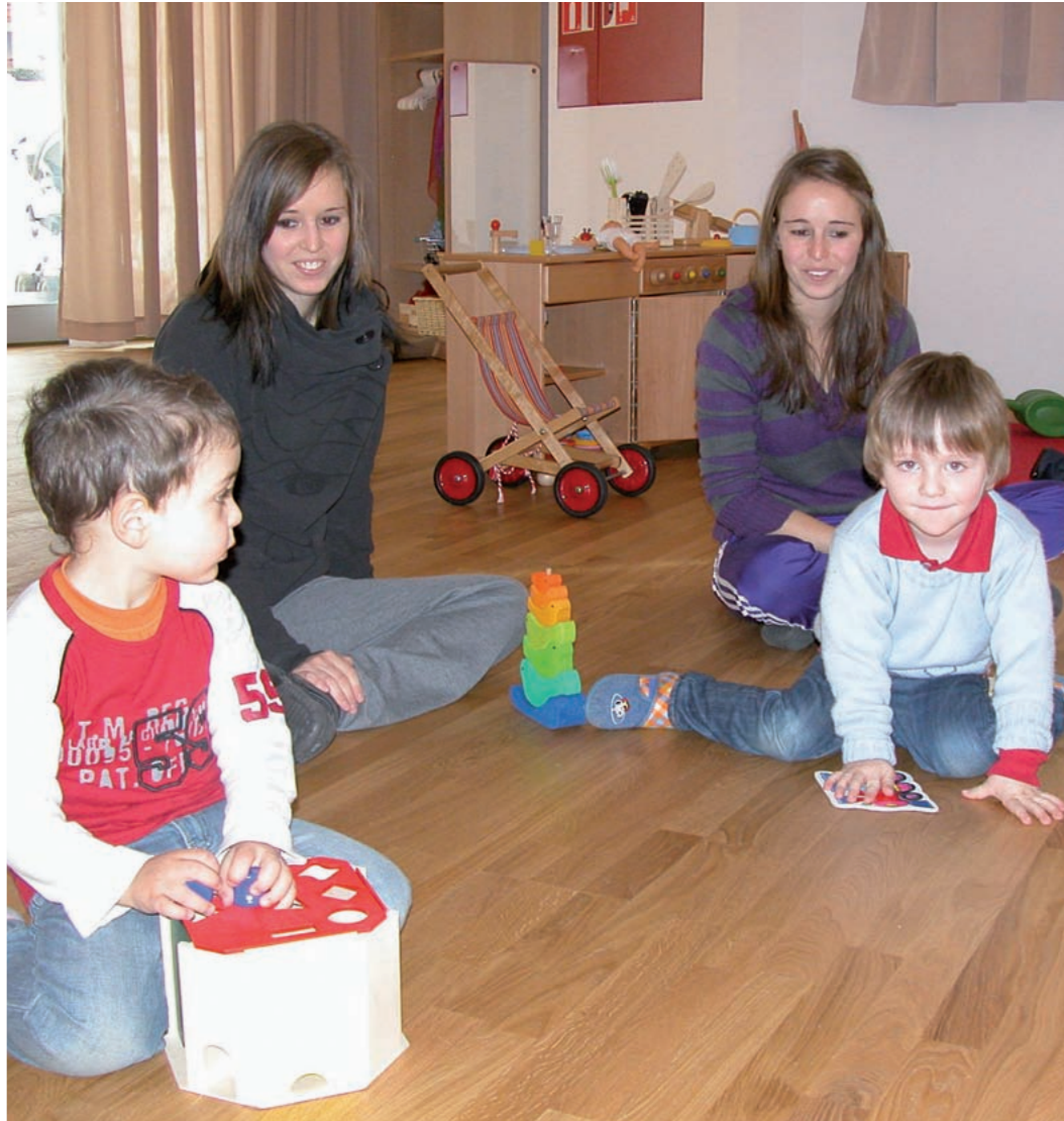
Assistenza ai bambini: a Campo Tures si è fatto un altro passo in avanti

Il Kitas di Campo Tures garantisce assistenza ai bambini di età massima pari a tre anni, ed ai loro genitori, dal 1° gennaio al 31 dicembre. Nel periodo massimo di apertura dell'asilo, ossia dalle ore 7.30 alle 16.00, possono essere presenti contemporaneamente 20 bambini. In tale lasso di tempo sia orari di ricevimento, sia il ritiro dei bambini