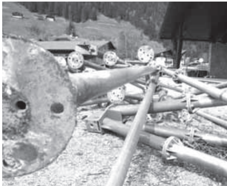
Della vecchia piazza delle feste non rimane che lo scheletro in metallo

La preesistente cabina elettrica sarà sostituita e rinnovata. Si aggiungerà un impianto di riqualifica del calore, generato dai macchinari che