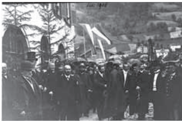
Un fitto numero di persone nel 1908 a Campo Tures.