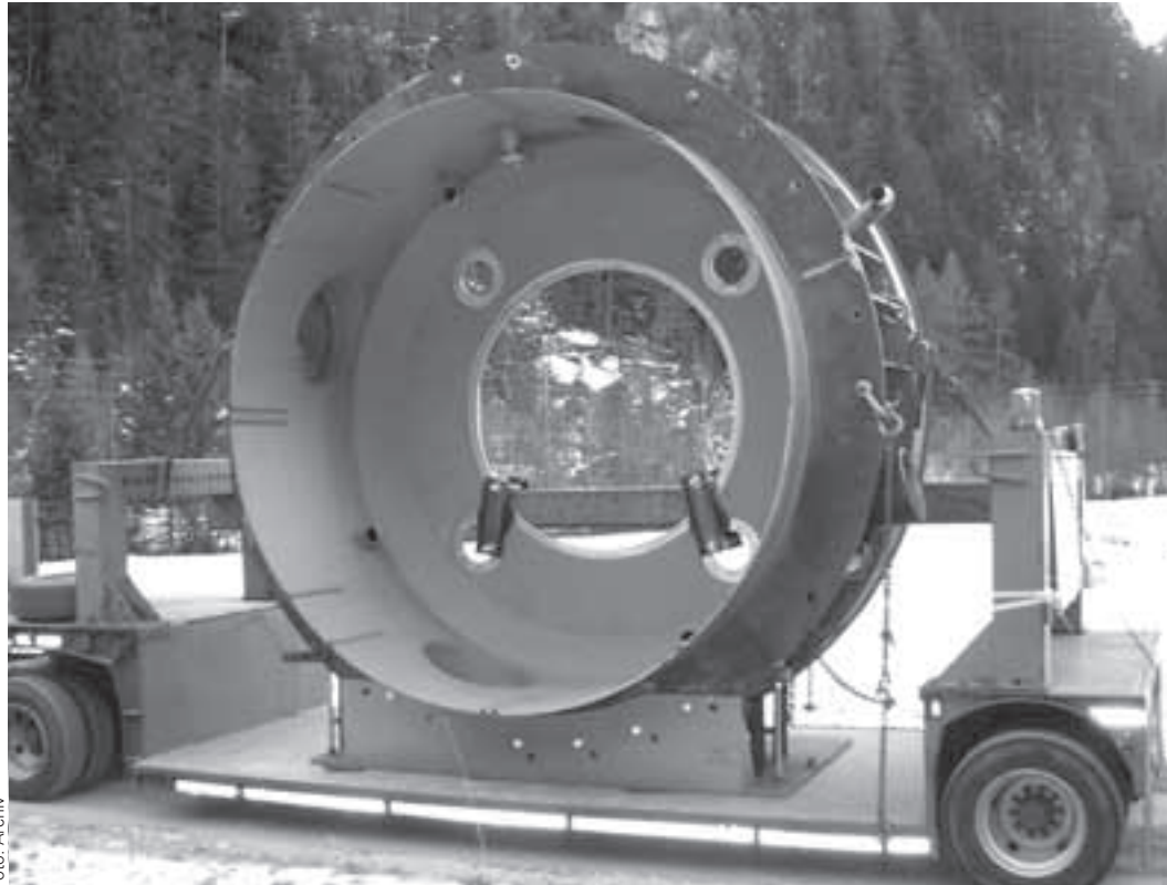
Una fornitura pesante: parti della grande turbina durante il loro trasporto.

Il nostro comune ha attualmente un consumo di energia medio di circa 22 milioni di kilowatt/h. La futura sovrapproduzione avrà discreti vantaggi per le casse comunali. Per pot-