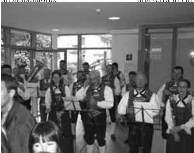
Musica: la cappella musicale di Molini all'unisono