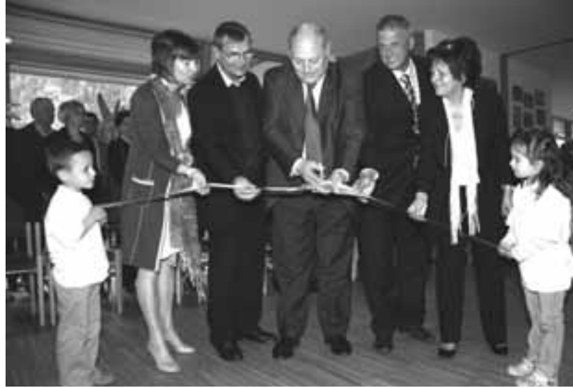
Taglio del nastro: cinque grandi e due piccini e ... zic-zac!