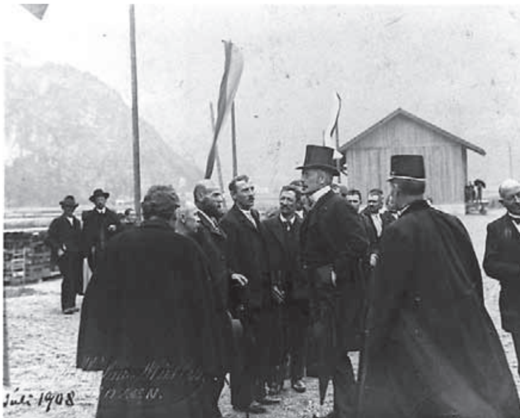
Frac, cappotto e cilindro: personalità dell'epoca durante l'inaugurazione del "Bahndl".

Nella prefazione del giovane studente si legge: "nel mondo odierno, caratterizzato da una costante globalizzazione, il tema della mobilità non si può più eliminare dalle discussioni sul tema. Le persone hanno richieste chiare e vogliono viaggiare intorno al globo sempre più velocemente, sempre più comodamente e vogliono arrivare sempre più lontano. Mentre oggi l'uomo è riuscito a raggiungere anche la luna, le persone che 100