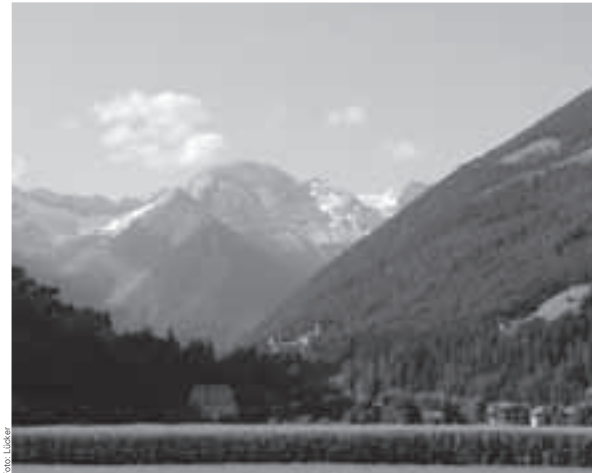
Bild: Osservatori da lontano: la giuria internazionale è rimasta molto ben impressionata.

Il ferro va battuto finché è ancora caldo, dice un antico detto che trova riscontro in tutte le lingue. Per questo motivo il comune ha deciso di rendere nota a tutti la gioia per il premio vinto. In agosto, in tempo da record, è stata quindi creata una speciale edizione di un giornale con unica tematica: il premio per il rinnovo paesano europeo. Una parte della tiratura complessiva del giornale, dal titolo "Sand-Uhr", sarà tradotta in inglese e presentata a Koudum come mezzo pubblicitario e per rappresentare al meglio il comune.