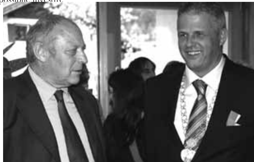
Parole importanti: il presidente della provincia ed il sindaco